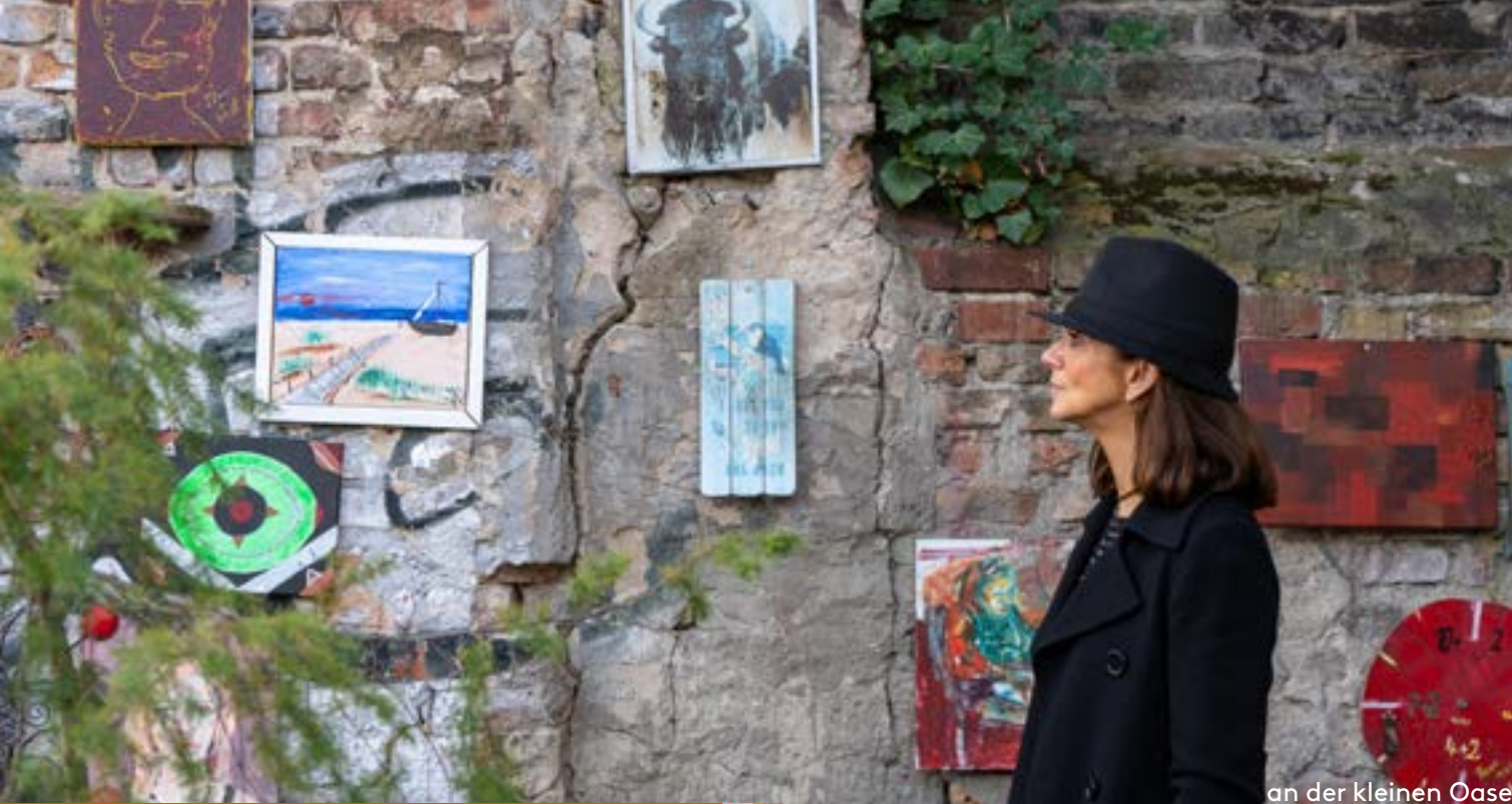
an der kleinen Oase